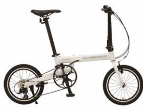
レンタル料金 半日 1,500 円 | 1日 2,000 円