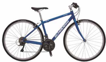
レンタル料金 半日 2,000 円 | 1日 2,500 円

季節による各地域の風景は地域の皆様方の暮らしにより保たれています。 農地やあぜ道その他アスファルト以外の道及び住宅敷地内等への立ち入りはご遠慮ください。